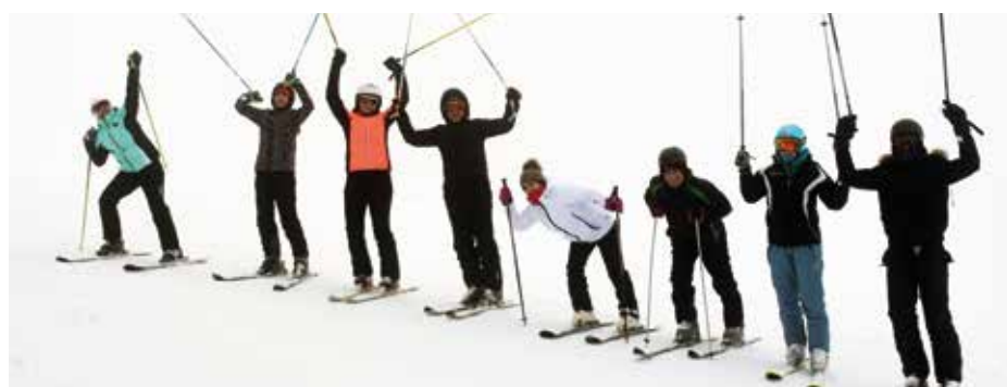
Člani Društva krajanov Spodnjega in Zgornjega Tuštanja so se odpravili na smuko na Pohorje, kjer jih je s smučišč pregнала šele megla.

V predlogu programa za leto 2019 se je poročalo o že izvedenih aktivnostih v začetku leta, rednih društvenih delavnicah, ki so organizirane po stalnem urniku dvakrat mesečno in spremljajočih dogodkih. V mesecu marcu se bosta izvedli še dve delavnici vezanja. Zopet bomo sodelovali na prireditvi »Po nagelj na Limbarsko goru« in na razstavi rož