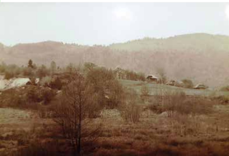
Pogled od Straže proti Drtiji v sedemdesetih letih prejšnjega stoletja.