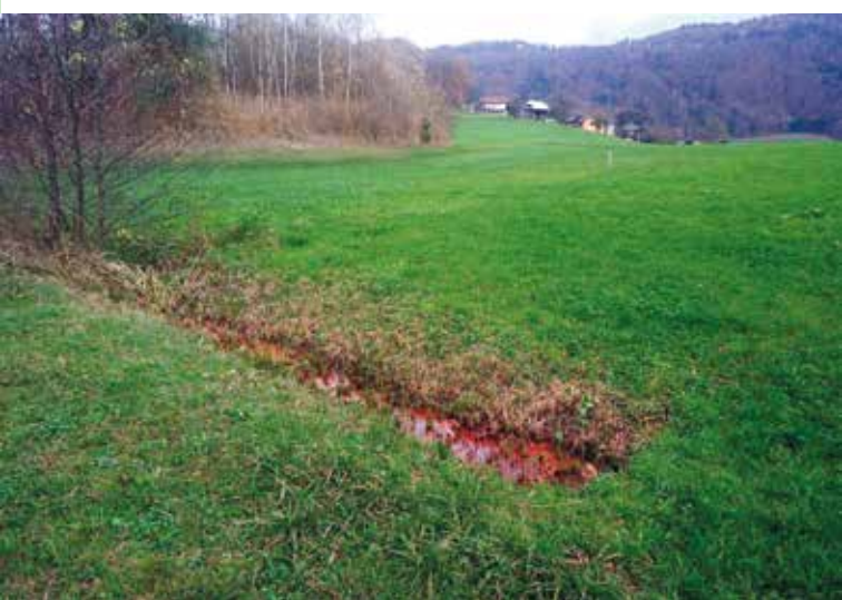
Odtočni kanal na koncu deponije

V nadaljevanju sem predstavil primer odvoza nevarnih snovi iz podjetja Termit pooblaščenim