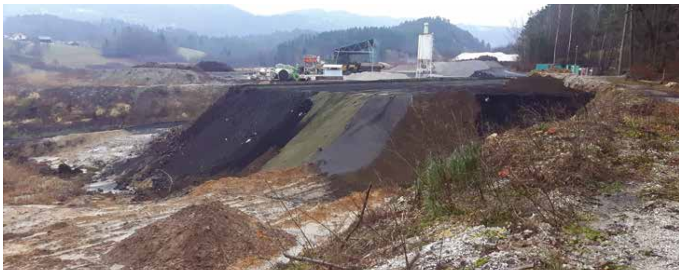
Potek sanacije odkopa

če že ne nezakonito ravnanje podjetja pri predelavi odpadkov.