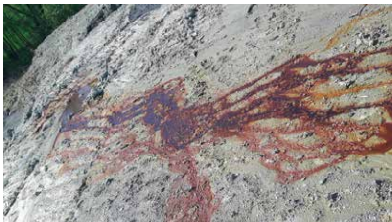
Izcedne vode iz telesa deponije

Okroglo mizo je zaključil župan Balažič in dejal,