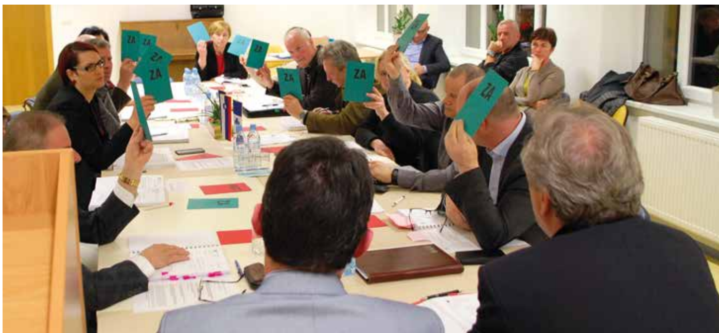
Na seji občinskega sveta konec februarja so bili vsi sklepi, z izjemo dveh, soglasno sprejeti.