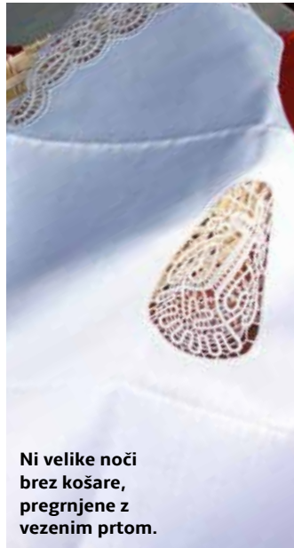
Ni velike noči brez košare, pregnjene z vezenim prtom.