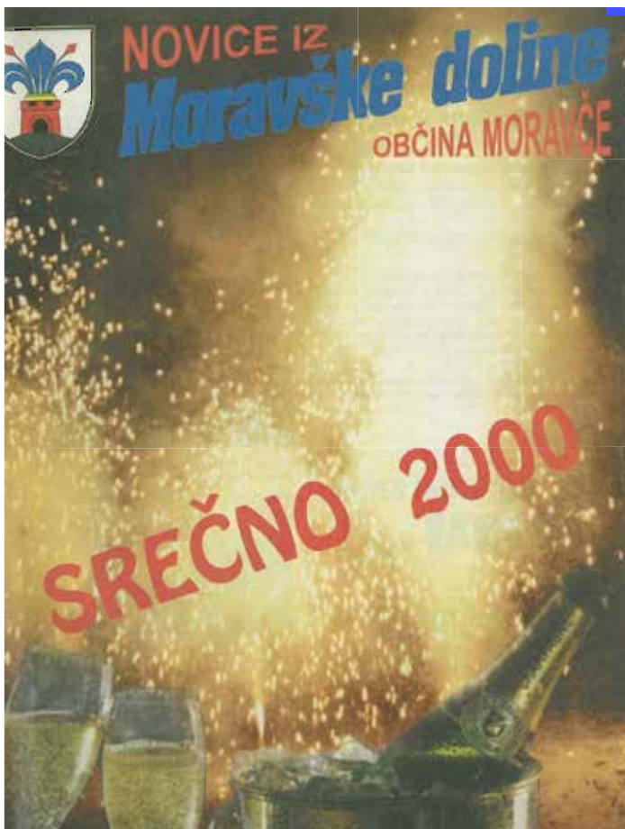
Naslovnica prve številke Novic iz Moravske doline, ki je izšla decembra leta 1999.