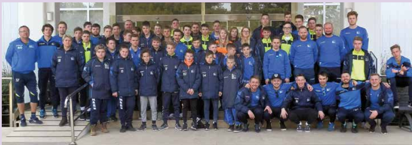
Priprav v Rovinju se je udeležilo več kot šestdeset članov moravškega nogometnega kluba.

Zahvaljujemo se vsem – staršem in igralcem, ki ste finančno pripomogli pri izvedbi letošnjih priprav ter pohvala vsem trenerjem, prisotnim nogometašem in spremljevalcem za dobro opravljanje svojega dela na pripravah. Zahvaljujemo se prevoznikstvu Pestotnik, ki je poskrbel za varno vožnjo naših članov, in trgovini SPINA iz Kraš, ki je prispevala malico za vse udeležence na pripravah.