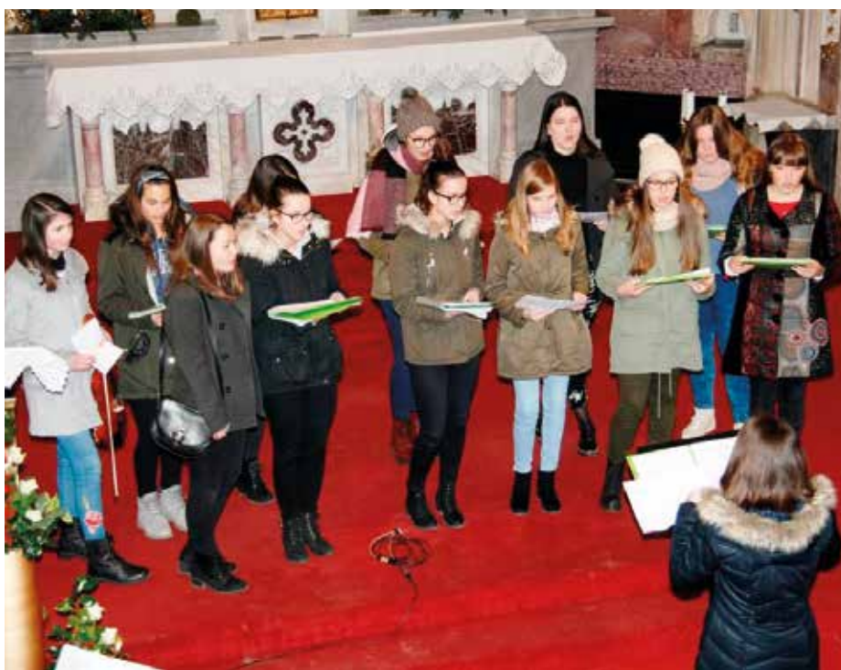
Moravški zbor je, kot vedno, navdušil poslušalce.